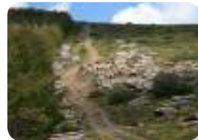
Numerosos cortafuegos se extienden por toda la zona para proteger al pinar en caso de incendio.

Al cabo de tan sólo 150 metros de suave ascenso, abandonaremos la pista forestal para internarnos hacia la izquierda en el pinar de repoblación, donde cruzaremos en repetidas ocasiones los diferentes bucles del carril de servicio que durante los meses invernales es utilizado como circuito de esquí de fondo.