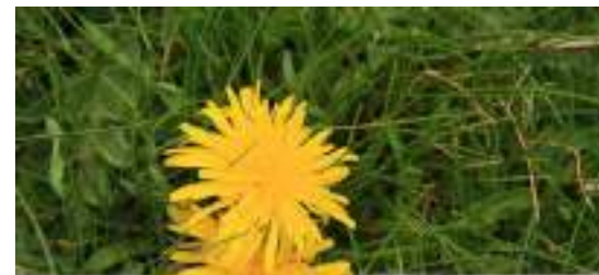
Diente de León

Seguiremos por el carril durante 900 metros más, dejando atrás un refugio de pastores [4] antes de llegar a la intersección con un cortafuego, donde abandonaremos el camino principal así como el sendero Sulayr, para tomar hacia la derecha el camino [5] que conduce a Lagunilla Seca.