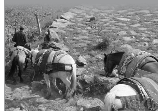
Estampa del pasado, cuando era necesario cruzar La Alpujarra con reatas de mulas.

Por último, no debemos olvidar que el puerto de la Ragua es un destacado enclave histórico, por el que cruzaron los ejércitos cristianos durante las Guerras Moriscas de La Alpujarra, que de 1.568 a 1.570 hicieron zozobrar la hegemonía castellana en el reino de Granada y que propiciaron la posterior expulsión de los moriscos de España.